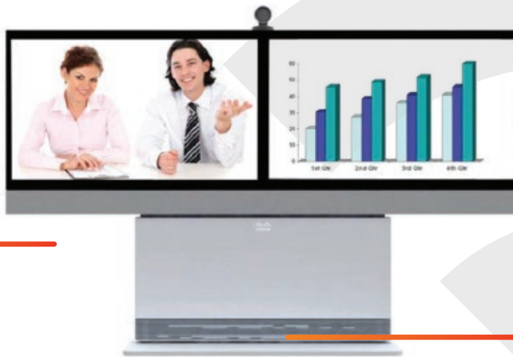
Dual 55" LCD