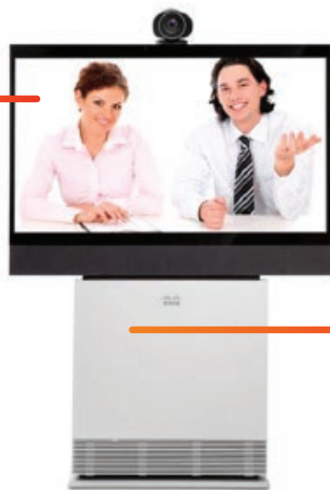
Single 55" LCD